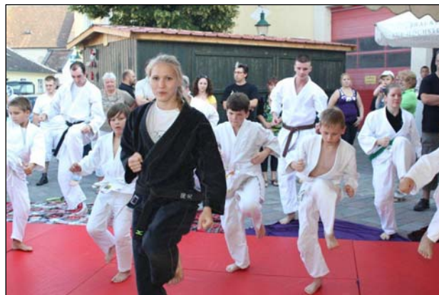
Jiu Jitsu Vorführung bei Kirtag 2012