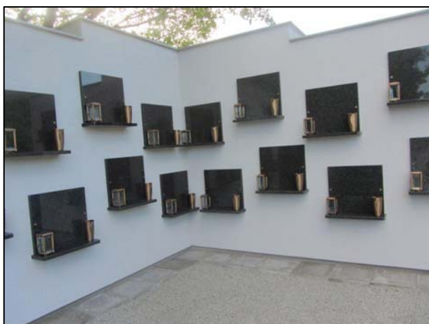
Urnenwand am Friedhof Weigelsdorf