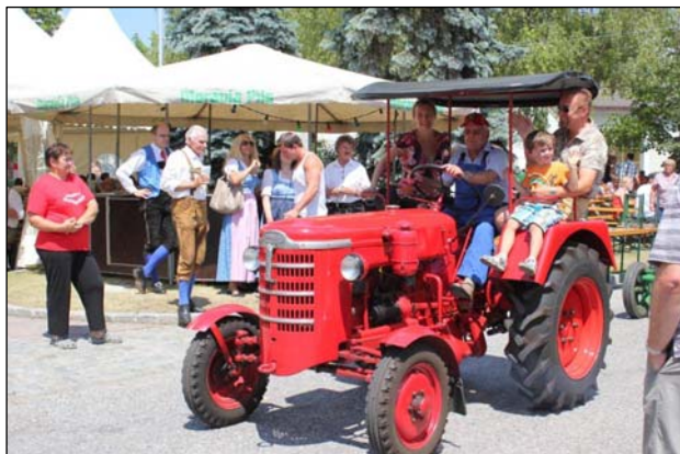
Oldtimer Traktor bei Kirtag 2012