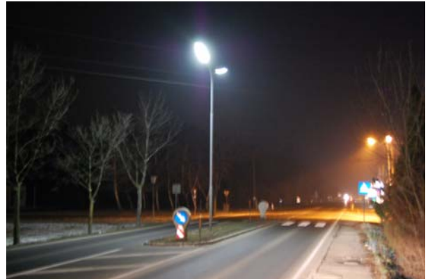
Weigelsdorf Richtung Pottendorf beim Friedhof