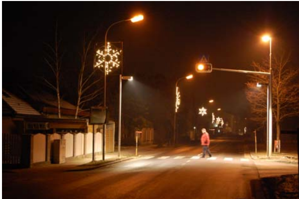
Oberwaltersdorf Richtung Baden nach Bahnübergang

Gemeinde Ebreichsdorf weitergeleitet und hoffen auf baldige Antwort.