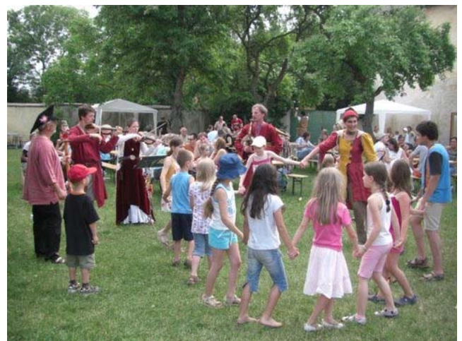
Zackenzilli mit begeisterter Kinderschar